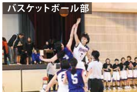
バスケットボール部

令和元年度 インターハイ走高跳出場 関東大会出場、走高跳4位 関東選抜大会5000m競歩3位入賞