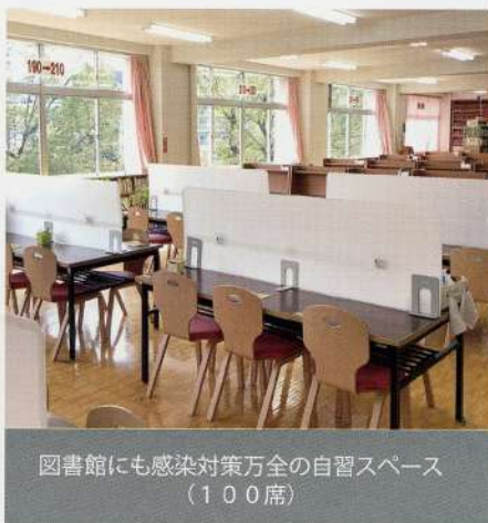
図書館にも感染対策万全の自習スペース(100席)