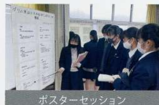
ポスターセッション

さまざまなジャンルの新聞記事を読み、内容をまとめ、感想を書く取り組みもしています。