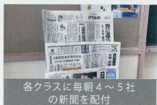
各クラスに毎朝4～5社の新聞を配付

※令和4年度入学生から教育課程が変わるため、人文科学探究の授業はなくなりますが、様々な探究活動は継続して実施されます。