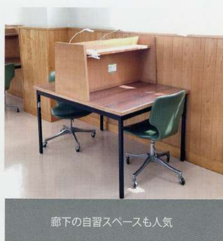
廊下の自習スペースも人気