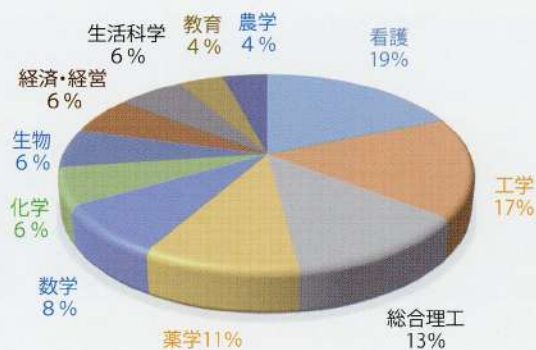
【理型48名の進路(2020年度卒)】

理型は、国公立大学に進学する人が多いのが特徴です。また、進路は主に理学部と工学部に分かれます。理学部は、数学科や物理学科、化学科や生物学科など学校の授業で学習した内容をさらに深く研究したい人に向いています。工学部は、土木工学科や建築学科、情報科学科や応用化学科など学問を応用して実生活に役立てたいと考えている人に向いています。