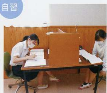
放課後も自主学習