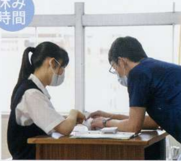
休み時間も熱心に授業の質問