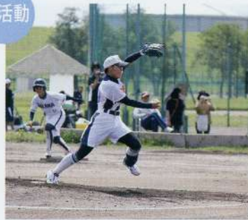
部活動にも全力投球!