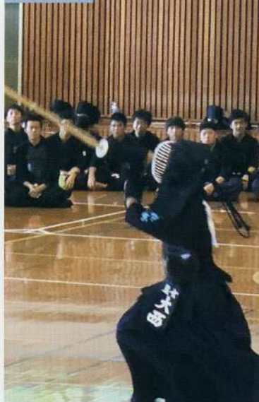
平成30年度 県剣道大会個人3位 北部地区団体2位 令和元年度 さいの国剣道大会3位