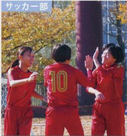
令和元年度 埼玉県新人大大会第7位