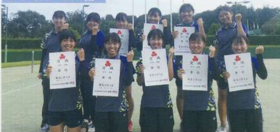
令和元年度 関東大会個人・団体出場