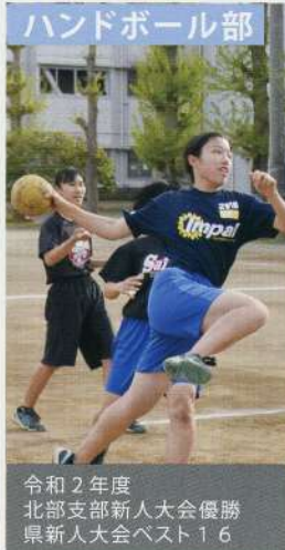
令和2年度 北部支部新人大大会優勝 県新人大大会ベスト16